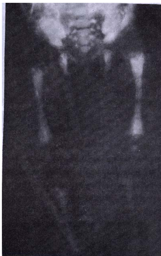
تصویر ۴: وجود نمای Bone in Bone در Femur و Tibia