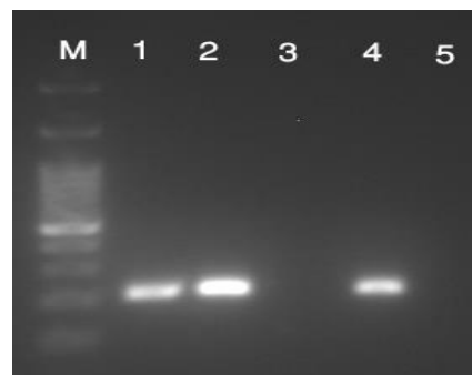
تصویر شماره ۱: تصویر ژل الکتروفورز مربوط به ژن sea استافیلوکوکوس اورئوس M: اندازه نشانگر DNA (1000 bp)، ۱ و ۲: سویه های حامل ژن Sea (اندازه محصول 210 bp)، ۳: سویه فاقد ژن Sea ، ۴: کنترل مثبت، ۵: کنترل منفی

نتایج مربوط به تکثیر ژن های انتروتوکسین های A و B به روش PCR، در تصاویر شماره ۱ و ۲ نشان داده شده است.