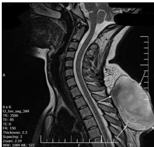
تصویر شماره ۲: ضایعه هتروژن با حاشیه مشخص در بافت subcutaneous با گسترش تا supraspinatus ligament در محاذات C7-T5

در MRI و CT انجام شده قبل از جراحی، توده نسج نرم در ابعاد ۱۴۰*۱۲۶*۱۱۴ میلی متر مشاهده شد و همان طور که در تصاویر مشخص است توده حدود مشخص داشته و به مهره ها و کانال نخاعی دست اندازی نداشت (تصویر شماره ۱).