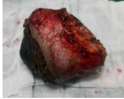
تصویر شماره ۳: تومور بعد از خارج سازی

بدینوسیله نویسندگان از پرسنل محترم بیمارستان ولی عصر (عج) اراک، کمال تشکر و قدردانی را می‌نماید.