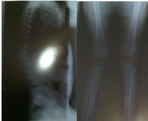
تصویر شماره 3: در گرافی انجام شده genu valgum و انحراف غیر طبیعی ستون فقرات دیده می شود

در سونوگرافی شکم کبد و طحال بزرگ تر از نرمال بود و در بررسی قلب، یک سوفل سیستولیک 2/6 به همراه mild LVH و mild MR and MVP و تغییرات میکروماتوئید در بچه های قلبی گزارش شد. از نظر ذهنی بیمار عملکرد مناسبی داشت. در معاینات چشمی هر دو چشم هیپروپ +6 دیوپتر، دید اصلاح شده چشم راست 5/10 و دید چشم چپ 6/10 بود. در معاینه با اسلیت لامپ Diffuse ground glass corneal clouding در هر دو چشم رویت شد. فشار هر دو چشم 12 میلی متر جیوه بود و در معاینه رتین و عصب اپتیک نکته پاتولوژیکی رویت نشد. برای بیمار، Macular OCT انجام شد که widening of foveal depression ناشی از straightening of Henle layer مشهود بود (تصویر