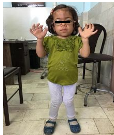
تصویر شماره 1: سر بزرگ، گردن کوتاه، بینی پهن، دست های چنگکی و انحراف زانوها

بیمار، دختر 5 ساله ای بود که به علت کاهش بینایی در سال 1398 به بیمارستان امام خمینی(ره) کرمانشاه ارجاع شد. بیمار فرزند اول خانواده بود و پدر و مادر رابطه فامیلی نداشتند و هر دو سالم و بدون بیماری زمینه ای بودند. بیمار قامت کوتاه نسبت به سن، سر بزرگ و گردن کوتاه، صورت خشن، قوس ابرو و فک برجسته، ماکرو گلوسی و دندان های نامنظم داشت (تصویر شماره 1). دفرمیت دست ها به صورت دست چنگکی (Claw hand) (تصویر شماره 2) و انحراف زانوها (Genu valgus) و انحنای غیر طبیعی ستون فقرات (تصویر شماره 3) و همچنین محدودیت حرکت مفصل هیپ به سمت بالا داشت.