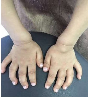
تصویر شماره 2: در این تصویر دست چنگکی و انحنای در انگشتان مشخص است.