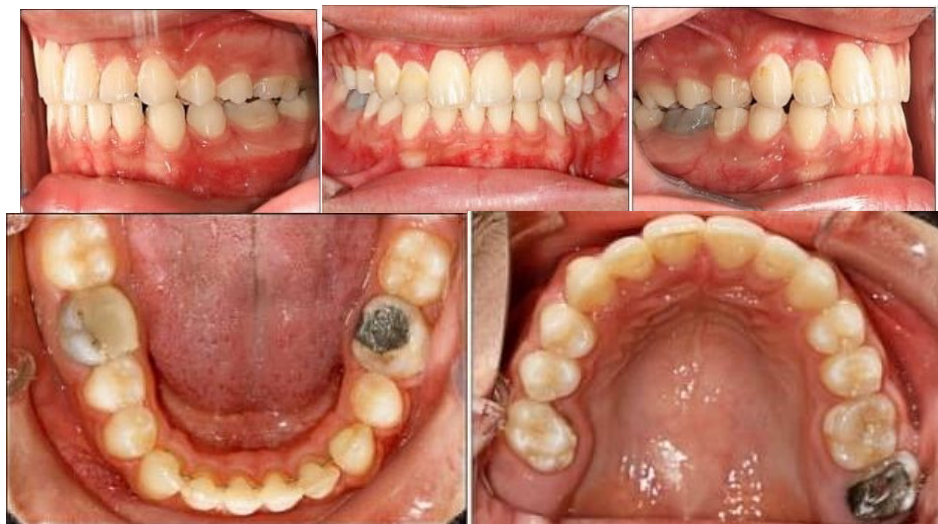
تصویر شماره 3: موقعیت دندان‌های بیمار در نمای باکال و اکلوزال پس از درمان

هدف برگرداندن کانین جابه‌جا شده به مکان اصلی خود و تامین فضا جهت رویش سانترال نهفته و به دنبال آن اصلاح میدلاین بود. پس از باند دندان‌های ماگزایلا، به کمک اپن کویل اسپرینگ (open coil spring)، WISCONSIN، AMERICAN ORTHODONTICS (USA) برای بیمار نصب شد. اینکار (روی سیم 20 استیل WISCONSIN، AMERICAN ORTHODONTICS) (USA)، فضای لازم جهت رویش دندان سانترال نهفته تامین گردید. به محض تامین فضای کافی برای رشد سانترال، جهت نمایان شدن دندان نهفته به حفره دهان از طریق جراحی، بیمار به جراح فک و صورت ارجاع داده شد. پس از ایجاد برشی با موقعیت اپیکالی، اتچمنت ارتودنسی (AMERICAN ORTHODONTICS) (USA، WISCONSIN) بر روی سانترال نهفته نصب و با اعمال نیروی ارتودنسی، حرکت آن به محل صحیح در قوس دندانی آغاز گردید. جهت خروج ریشه از خار بینی قدامی، نیرو به سمت اپیکال وارد شد. به طور همزمان روی کانین نیز به وسیله‌ی الاستیک چین (WISCONSIN، AMERICAN ORTHODONTICS) (USA)، نیروی دیستالی اعمال گردید تا از سمت باکال