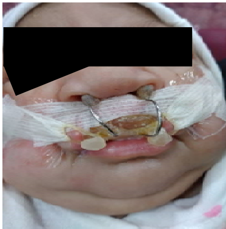
تصویر شماره 3: طریقه قرارگیری پلیت به کمک چسب و نوار الاستیک

از والدین خواسته شد طبق دستورات داده شده پلیت را تمام وقت استفاده کند و حداقل روزی یک بار آن را برای تمیز کردن از دهان نوزاد خارج سازند. برای گیر بیش تر پلیت از چسب‌های نگهدارنده در حالی که دو الاستیک به انتهای آن‌ها متصل بود، استفاده می‌گردید. نوارها و الاستیک‌ها هر 24 ساعت یک بار تعویض می‌شدند (تصویر شماره 3).