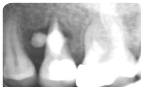
تصویر شماره ۴: پس از پر کردن کانال

این که از ست شدن MTA اطمینان حاصل شد، تاج دندان با آمالگام ترمیم شد. پس از شش ماه (تصویر شماره ۵) و ۲ سال (تصویر شماره ۶) معاینات پیگیری انجام شد. دندان بدون علامت بود و در رادیوگرافی بهبودی استخوان اطراف ریشه مشاهده شد.