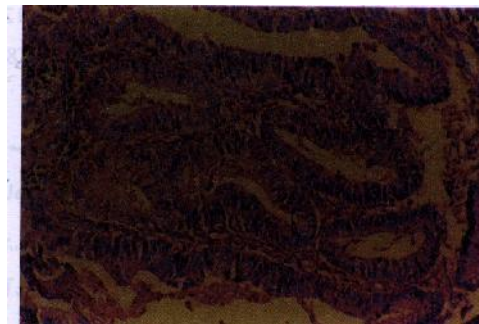
تصویر شماره ۲: مشخصات میکروسکوپی تومور

تومور پاپیلری از اپی تلیوم چند لایه متشکل از سلول های تومورال با هسته های گرد تا بیضی شکل و کروماتین خشن و تعداد متوسطی میتوز مفروش شده بود (تصویر شماره ۲).